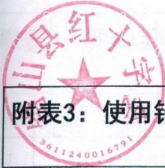
附表3：使用铅山县红十字会接受捐赠资金采购疫情防控物资支持医疗机构情况表